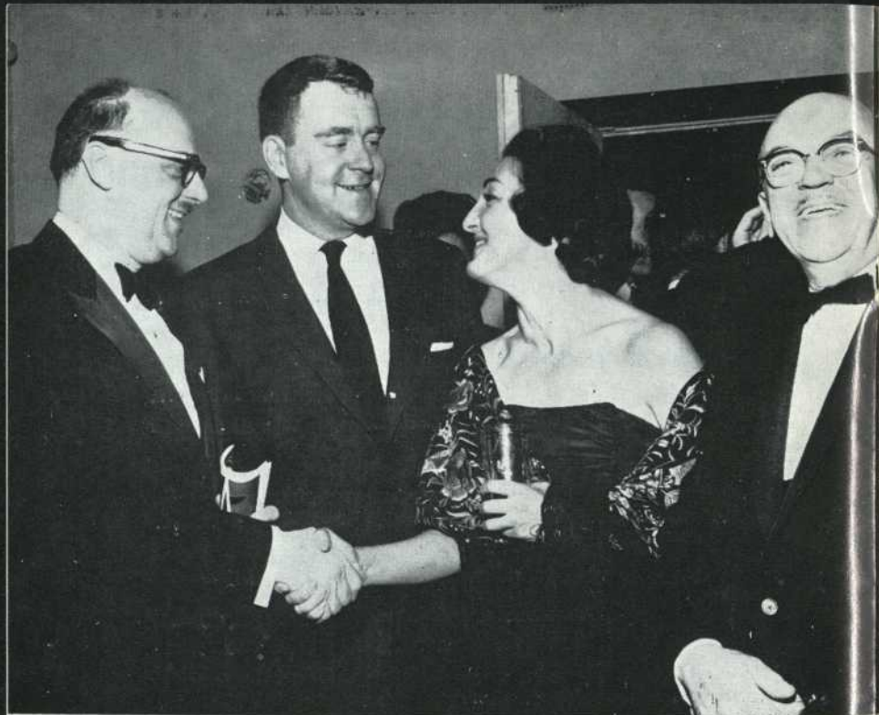
Photo prise lors de l'inauguration du Théâtre Stella et de la treizième saison de la Troupe du "Rideau Vert".