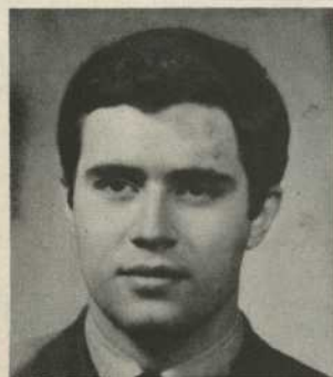
Louis De Céspedes