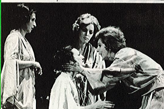
"CE SOIR ON IMPROVISE" de Pirandello