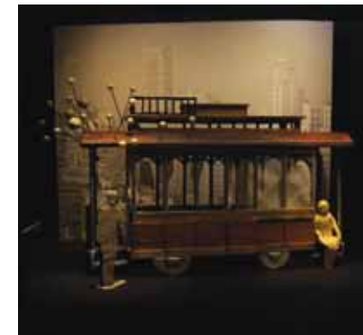
Décor NATALIA BOBROVICH